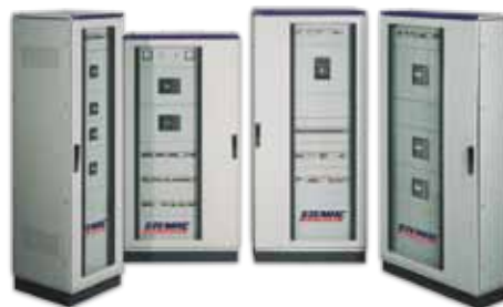
PAINÉIS DE BAIXA E MÉDIA TENSÃO CERTIFICADOS

A STEMAC apresenta soluções de alta confiabilidade em sistemas de energia, oferecendo painéis elétricos de baixa e média tensão, certificados pelas normas NBR IEC 60439-1 (TTA) e IEC 62271-200 (MT), bem como a automação de ponta a ponta para grupos geradores, através de controles microprocessados com tecnologia de última geração, que podem ser associados a Controladores Lógico Programáveis (CLP) e Sistemas Supervisórios nas mais variadas configurações.