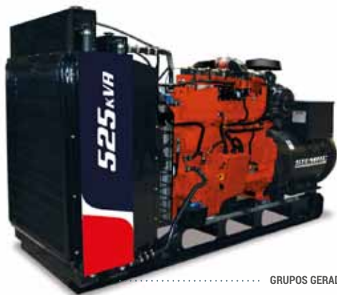
GRUPOS GERADORES A GÁS