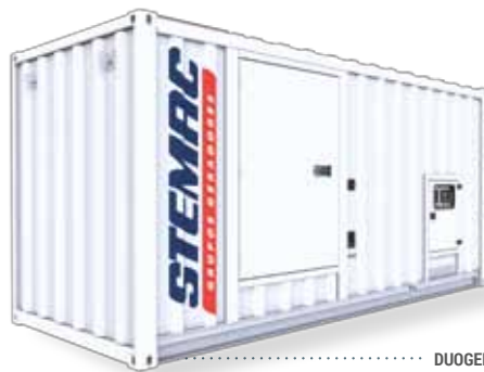
DUOGEN 1.000kVA (2x 500kVA) - 1.100kVA (2x 550kVA) 1.400kVA (2x 700kVA)

A STEMAC oferece a Linha Duogen, sistema de geração de energia composto de dois grupos geradores a diesel em paralelo em um único contêiner. Aplica-se também, para cargas críticas, com dois grupos geradores, sendo um emergência do outro, tornando-se um produto com maior flexibilidade de operação com carga total ou cargas reduzidas com um único grupo gerador.